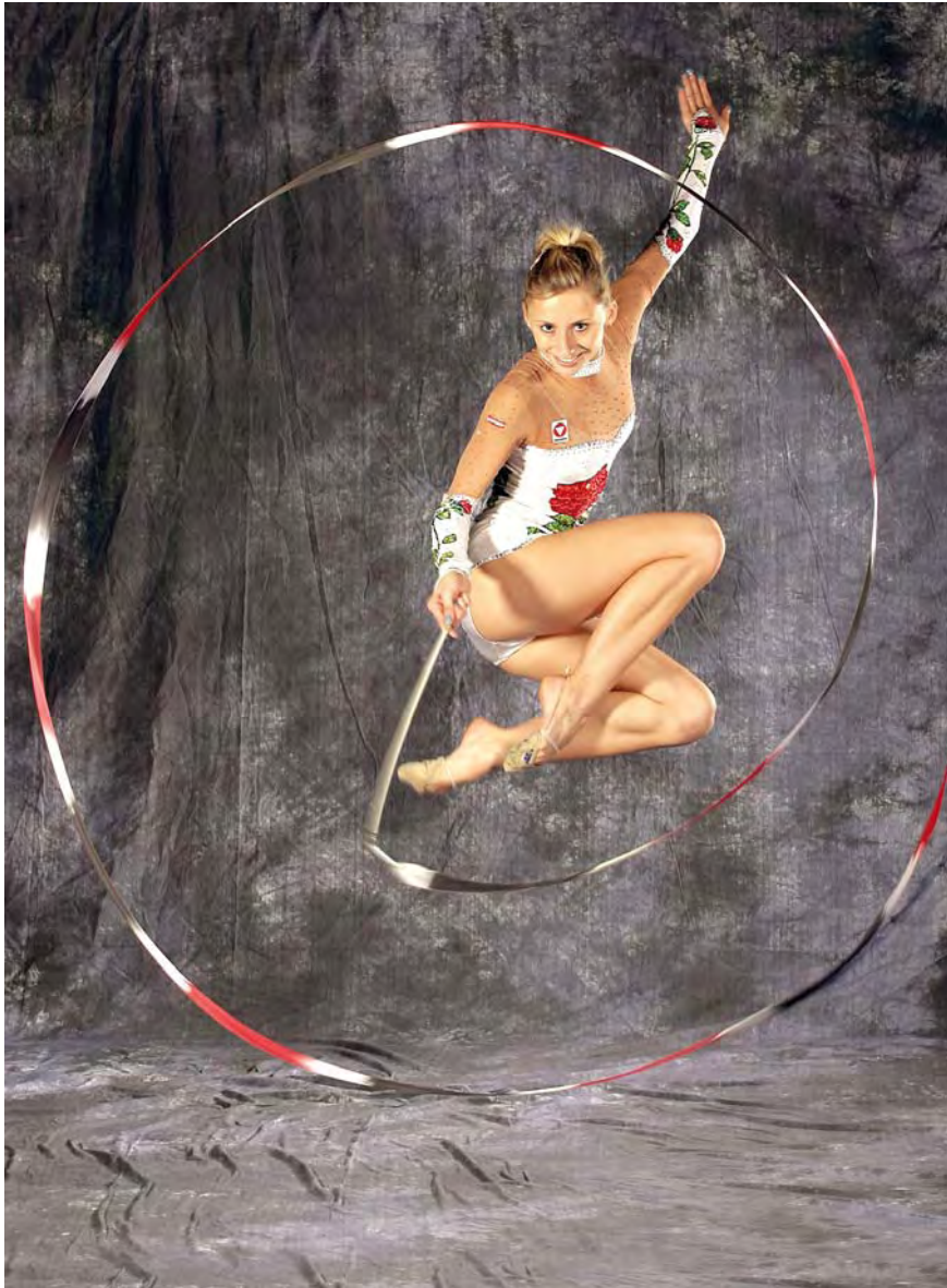
Geb. am 31. Mai 1986 in Dornbirn, Wohnort: Wien