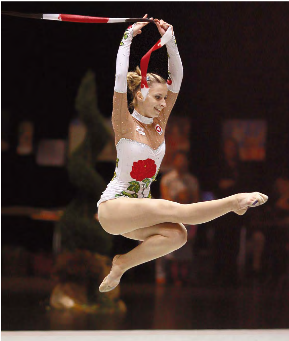
Heimatverein: Turnerschaft Dornbirn; Trainingsorte: Wien, St. Pölten, Dornbirn