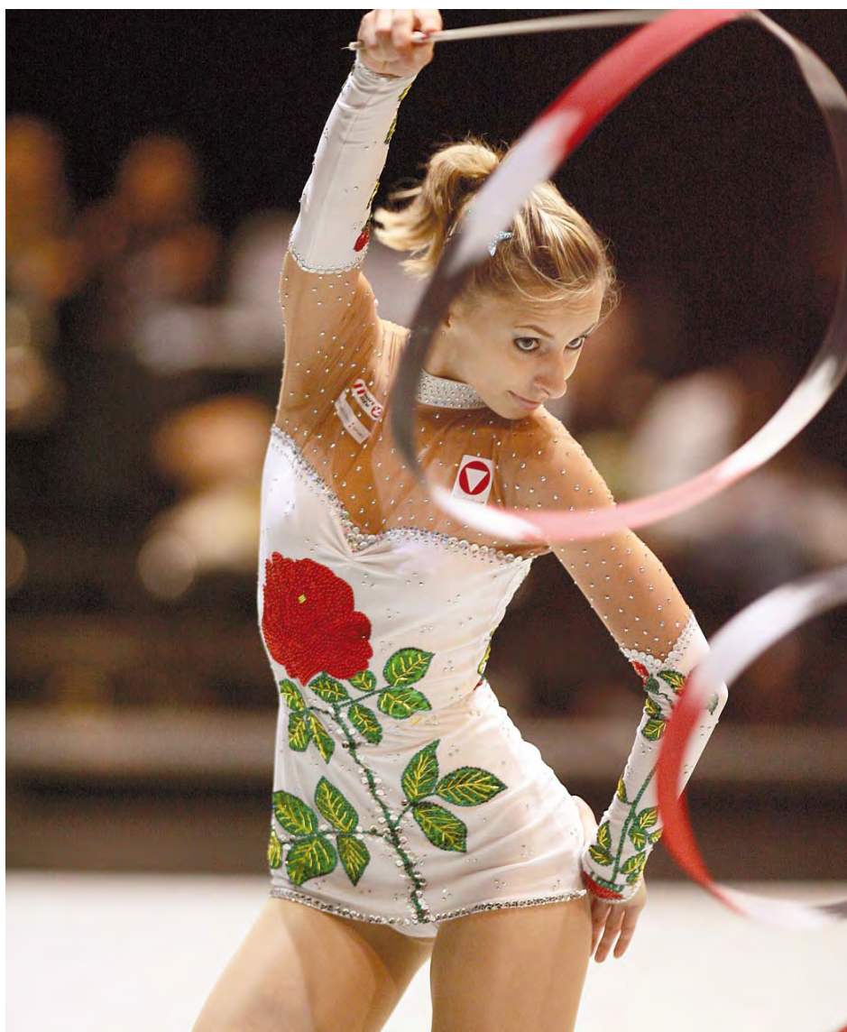
Ausbildung: AHS-Maturantin (Juni 2005) Beruf: Sportsoldatin (Profi-Sportlerin) Berufliches Ziel: Kriminalpsychologie (Studium in Wien)