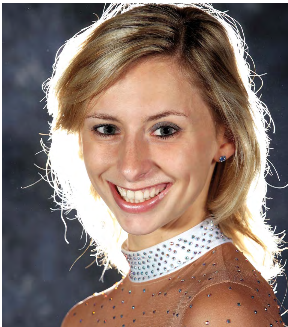
28 Staatsmeistertitel (Mehrkampf, Finali, Gruppe); Sportlerin des Jahres 2004 in Vorarlberg