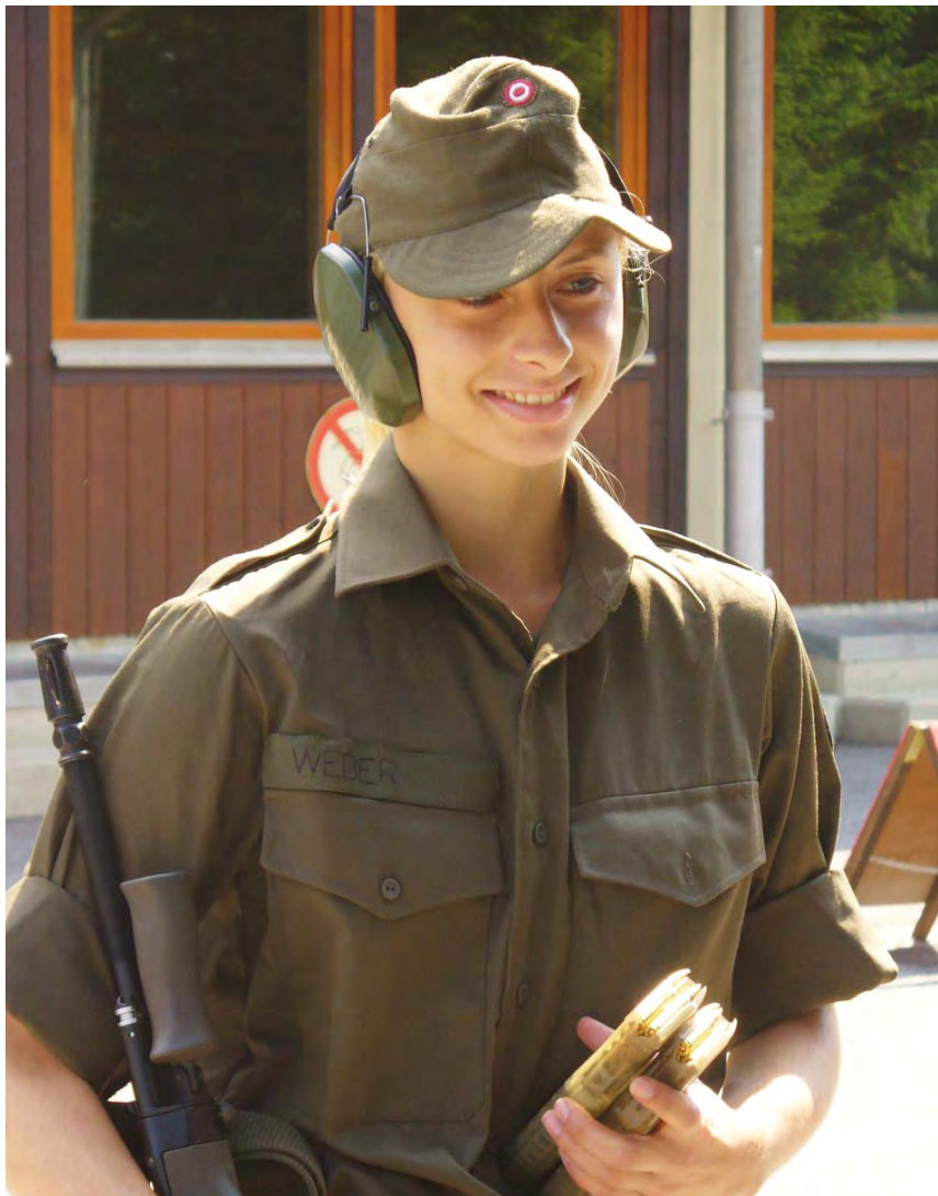
Erfolge auf dem Weg zur Olympiaqualifikation (Quotenplatz) 2007: Finalistin und 14. bei der WM in Patras/GRE und bei der EM in Baku Bei allen Weltcups und Grands Prix 2006/2007 zwischen Platz 12 und 19 Siebente der Universiade (Studenten-WM)